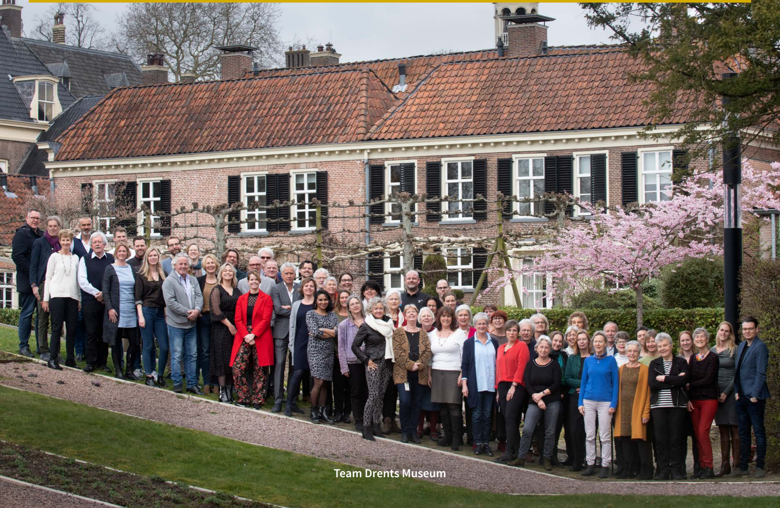
Team Drents Museum