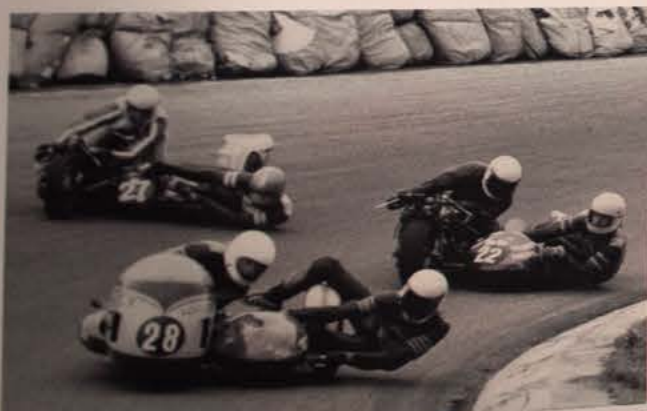
Streuer en Van der Kaap door de Hugenholtzbocht op Zandvoort, 1976.