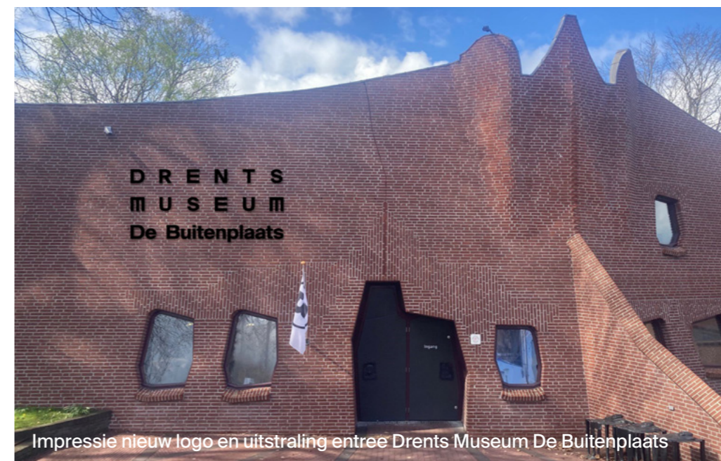
Impressie nieuw logo en uitstraling entree Drents Museum De Buitenplaats

Bovenstaande doelen worden per afdeling verder uitgewerkt.