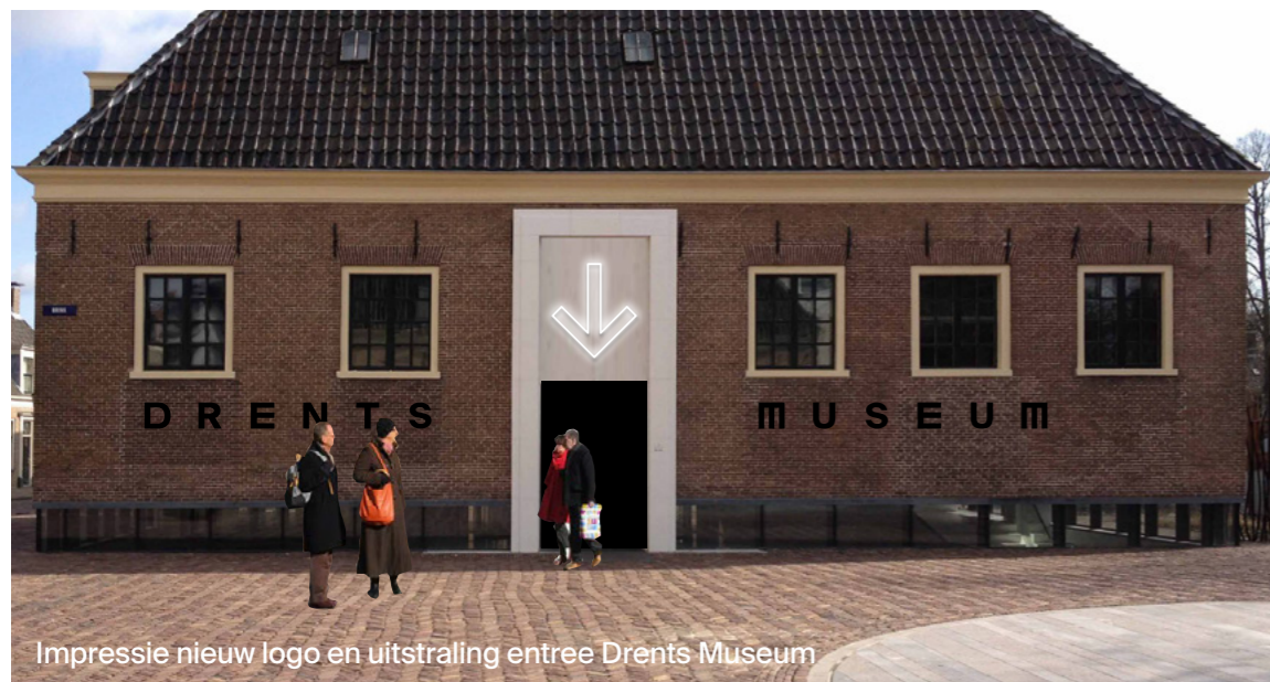
Impressie nieuw logo en uitstraling entree Drents Museum

We boden regelmatig programma's aan voor mensen voor wie een museumbezoek geen vanzelfsprekendheid is en die beperkingen ervaren bij hun bezoek. Daarnaast ontwikkelden we speciale programma's voor mensen met auditieve en visuele beperkingen, boden we prikkelarme rondleidingen aan en programma's voor specifieke doelgroepen en mensen met een andere culturele achtergrond. Onze nieuwe medewerker participatie en noaberschap bouwde de afgelopen jaren een relatienetwerk op met maatschappelijke organisaties in Drenthe.